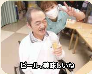
ビール、美味しいね