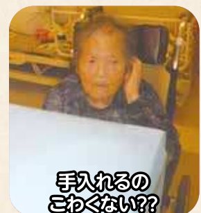
手入れるの こわくない??