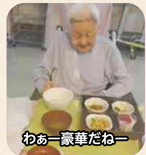
わあー豪華だねー