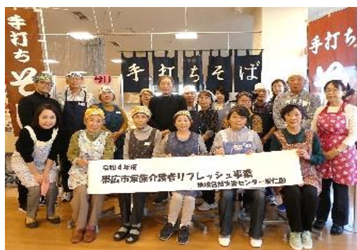
（上）参加者の皆様と記念撮影

12月1日（木） コープさっぽろ文化教室キッチンスタジオベルデ店にて、「令和4年度 第2回家族介護者リフレッシュ事業」を開催しました。内容は「そば打ち体験～美味しいそばで昼食会～」で、当日は10名の家族介護者の方々が参加されました。初めてそば打ちをされる方もいましたが、ボランティア「そば食べん会」の方より優しく丁寧に指導して頂き、参加者の皆様から「楽しい！」と声が上がっていました。昼食会では講師が打ったそばを