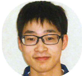
すずらんグループ