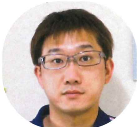
ひまわりグループ