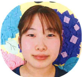
あじさいグループ

戻ってくるまでの5年間、違う地域の施設で働き今まで自分が学んできたことや目指してきたことをを活かし様々なことに挑戦してきました。その中で得た知識や技術を愛仁園でも活かしていきたい5年前を知っている人達に成長した姿を見せられたらと思っています。